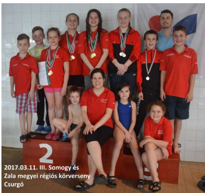
2017.03.11. III. Somogy és Zala megyei régiós körverseny Csurgó