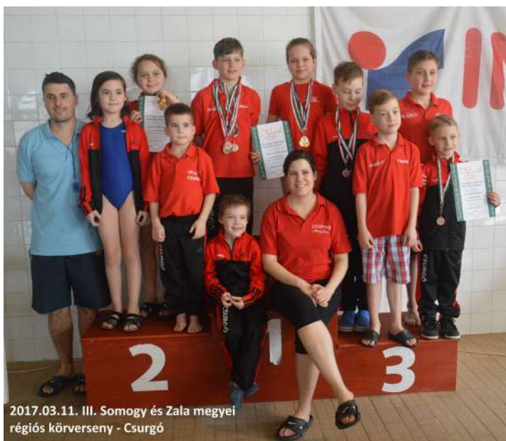
2017.03.11. III. Somogy és Zala megyei régiós körverseny - Csurgó