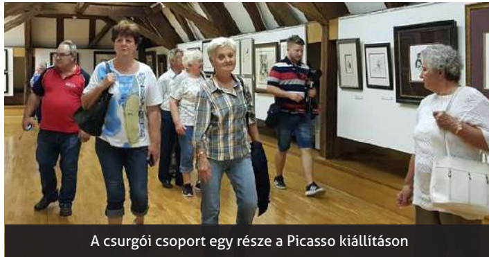
A csurgói csoport egy része a Picasso kiállításon

Dráva-ment egyik legjellegzetesebb süteménye a diós pogácsa, melyet hajtogatott, dióval rétegezett gyúrt tésztaból készítenek, és kisülés után ferde kockákra vágják fel. A diós pogácsa, mint nép étel Horvátországban felkerült a nem tárgyi kulturális javakhoz tartozó