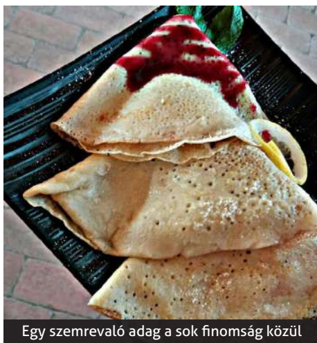
Egy szemrevaló adag a sok finomság közül

finom palacsintákat, a kinti közel 100 literes üstben pedig a babgulyás fortyogott. A palacsinták tölteléke és szemre való volt. A hagyományos lekváros, diós, kakaós, húsos, káposztás és egyéb finomságok mellett a különlegesebb mentás-túrós, jostás, áfonyás töltelékek is megjelentek. Gondolván az ételallergiásokra az egyik tűzhelyen glutén- és laktózmentes finomságok is készültek.