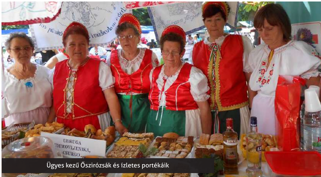
Ügyes kezű Őszirózsák és ízletes portékáik

Csodálatos pogácsákat és süteményeket rejtő dobozok, kosarak illatától volt édes és zamatos az Őszirózsza Nyugdíjas Klubot és vendégeit szállító autóbusz útban Gyurgyevác felé.