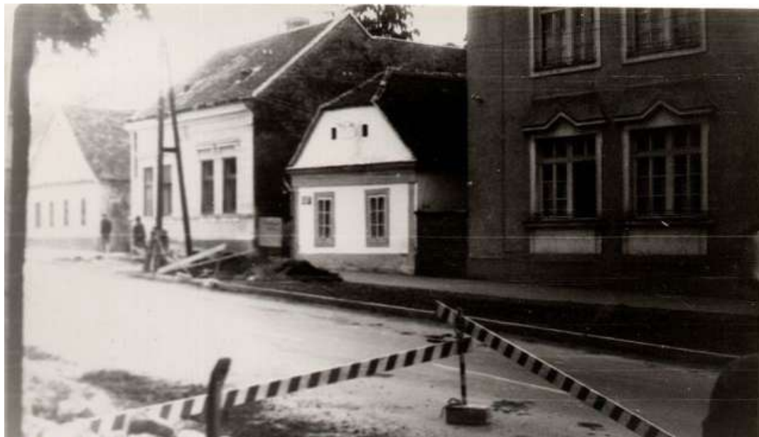
A Csokonai utca 1969-ben. Balról a második a 18-as számú ház.