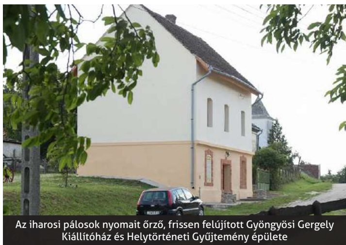
Az iharosi pálosok nyomait őrző, frissen felújított Gyöngyösi Gergely Kiállítóház és Helytörténeti Gyűjtemény épülete

A pálos települések találkozója 2011-ben indult útjára, közel 30 település részvételével, melynek ideai házigazdája Pécs, a Magyar Pálos Rend központja volt.