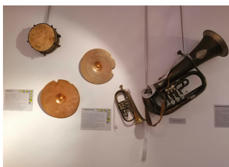
A tűzoltózenekar hangszerei