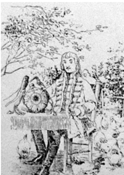
Csokonai a csikóbőrös kulcsával

Alsókban a zsupp fedeles Vadkacsa-kocsmá a Festetics-uradalom csárdája volt. A Csurgótól keletre, a berzencei határban lévő, Hatkerekű malom csárdájába pedig főként az őrletésre várakozó szomjas kocsis, paraszt és molnár legények tértek be egy pohárka áldomásra.