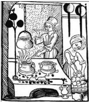
Középkori csárda belseje

Ezek a fogadók kezdetben a postautak mentén, a települések határán helyezkedtek el, aztán beljebb kerültek a lakosság szórakoztatására.