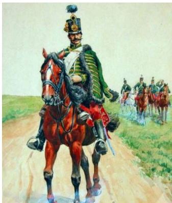
Zöld-piros ruhás Miklós ezredbeli huszár ábrázolása az 1840-es évekből

Március 15-i nemzeti ünnepünk egyik legismertebb jelképéül a kokárda mellett tovább él az 1848-49-es eseményekben hősiiesen szereplő huszárság emlékezete is. A 2023. évi, a forradalmi események 175. évfordulóján megrendezett állami ünnepségek egyik fő eseménye is a huszárok fel-, majd bevonulása a Múzeumkertbe volt. A szentendrei skanzenben szintén egész napos kiemelet rendezvény, Huszáros napot szerveztek a szabadteri néprajzi múzumba látogatók számára.