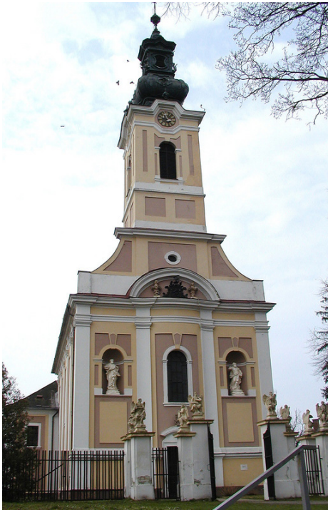
A Nicky család építette Szent Kereszt Felmagasztalása Templom

A szomszédos Berzence első írásos említése 1228-ban Birzence alakban fordul elő. Az azóta eltelt 795 év alatt sok-sok történelmi változást, eseményt, tulajdonos váltást ért meg ez a település. Az egykori birtokosai közül kiemelkedik az a jómódú köznemesi, majd grófi Nicky család, amelynek tagjai még a Festeticsiek előtt bírták a falu tulajdonjogát a ma már Csurgó részét képező egykori Sarkad településsel együtt.