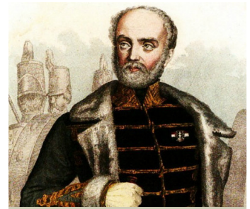
Bem József (1794-1850)

Az alsoki fő utca névadójáról, Arany Jánosról is tudjuk, hogy nemzetőrként részese volt a 48-as eseményeknek, és a belvárosi Jókai Mór utcának nevét adó íróról is ismert, hogy a márciusi ifjak egyikeként részt vett a 12 pont